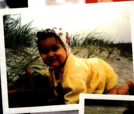
En söt glad liten sommartjej med hela livet framför sig.