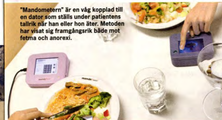
"Mandometern" är en våg kopplad till en dator som ställs under patientens tallrik när han eller hon äter. Metoden har visat sig framgångsrik både mot fetma och anorexi.