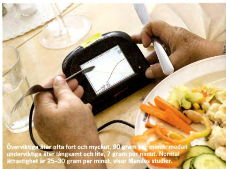
Överviktiga äter ofta fort och mycket, 90 gram per minut, medan underviktiga äter långsamt och lite, 7 gram per minut. Normal äthastighet är 25–30 gram per minut, visar Mandos studier.

Idag ingår någon form av träning i all vård för ätstörningar, men Cecilia Bergh tycker att det är tråkigt att Mandometermetoden fortfarande möter motstånd, trots att företaget har fyra kliniker i